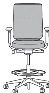
Reply Air Malla