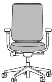
Reply Air Malla