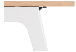
Tablero Esquinas rectas