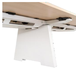
Gestión de cableado Capó pies intermedios