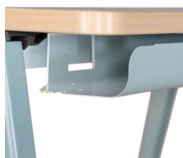
Gestión de cableado Bandeja estándar