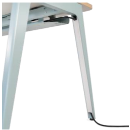
Gestión de cableado Tapa metálica pie