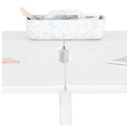
Acceso superior Rebaje