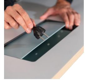
Acceso superior Tapa integrada metálica