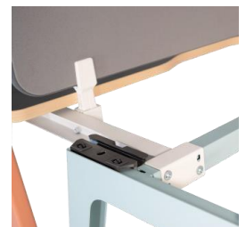
Accesorios Kit Mesa-a-Bench