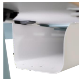
Gestión de cableado Bandeja gran capacidad