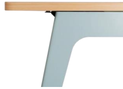
Tablero Esquinas redondeadas