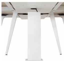
Gestión de cableado Tótem