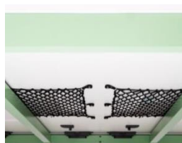
Gestión de cableado Red