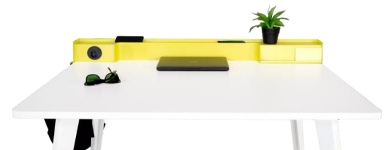
Accesorios Organizador de escritorio