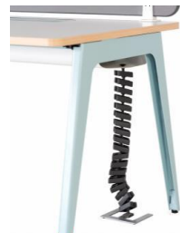
Gestión de cableado Espina articulada