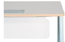
Faldón Metal / Laminado